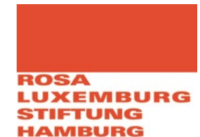
Rosa Luxemburg Stiftung Hamburg www.hamburg.rosalux.de