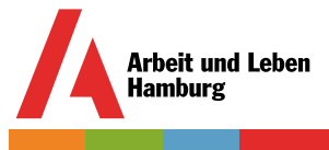
Arbeit und Leben Hamburg e.V. www.hamburg.arbeitundleben.de