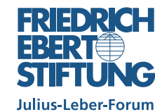
Julius-Leber-Forum der Friedrich-Ebert-Stiftung www.fes.de/julius-leber-forum